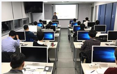
교육 실습을 위한 시스템 구성